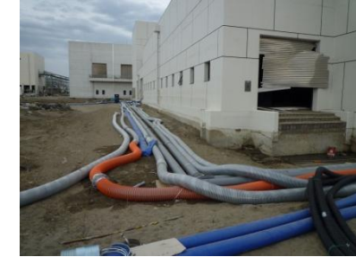
沈砂池ポンプ等から仮沈殿池への配管