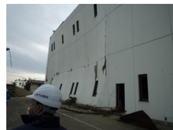
津波による破損 (第3ポンプ場)