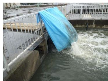
最初沈殿池へ排水（その2）