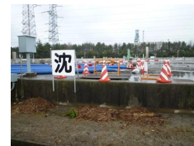
最初沈殿池へ排水（その1）