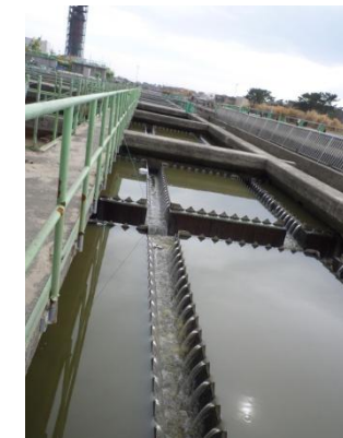
最初沈殿池 (仮沈殿池として使用)