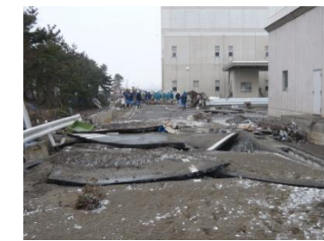
管理用道路の破損