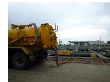
バキューム車による土砂の汲み上げ (最初沈殿池)