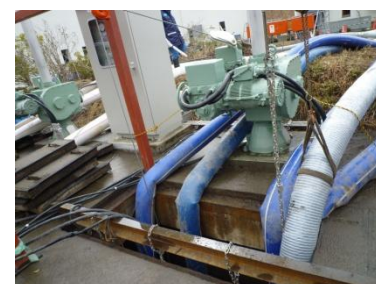
流入ゲートからの汲み上げ