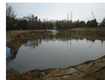
仮沈殿池 (近隣のグラウンドに設置)