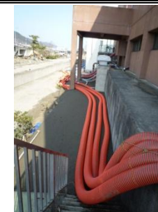
流入ゲートからの仮設配管