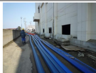
地盤が一律に沈下